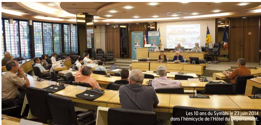
Les 10 ans du Symbhi le 23 juin 2014 dans l'hémicycle de l'Hôtel du Département.