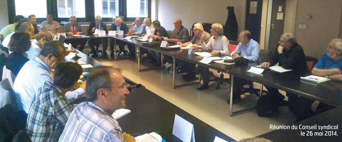
Réunion du Conseil syndical le 26 mai 2014.