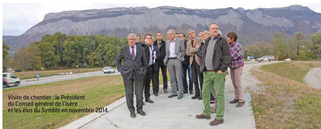
Visite de chantier : le Président du Conseil général de l'Isère et les élus du Symbhi en novembre 2014.

Rien que pour cette patience et cette volonté tenace de bâtir une approche commune autour d'un bien commun – notre système de protection – un grand merci Président.