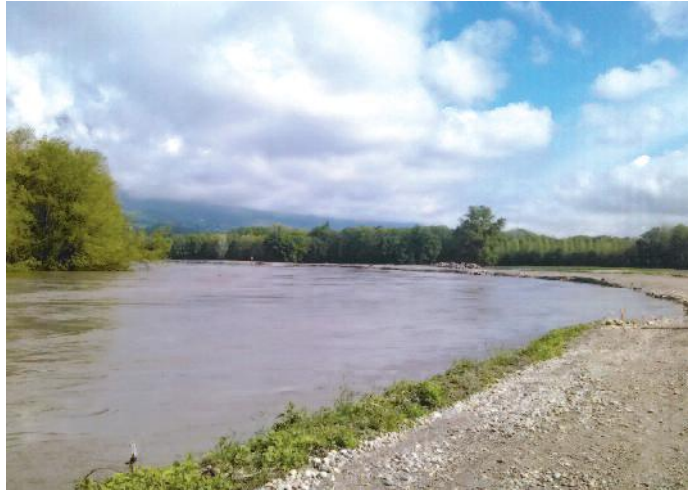
L'Isère en aval de la station de compostage de Murianette.

Aucun désordre notable n'a été constaté en rive droite de l'Isère où tous les travaux de confortement de digues étaient achevés. Par contre, en rive gauche et particulièrement au niveau de la plaine de Gières-Murianette, des interventions ont été effectuées en urgence. En aval de la station de compostage de Murianette, une surépaisseur de 50 cm de matériaux a été mise en œuvre le samedi