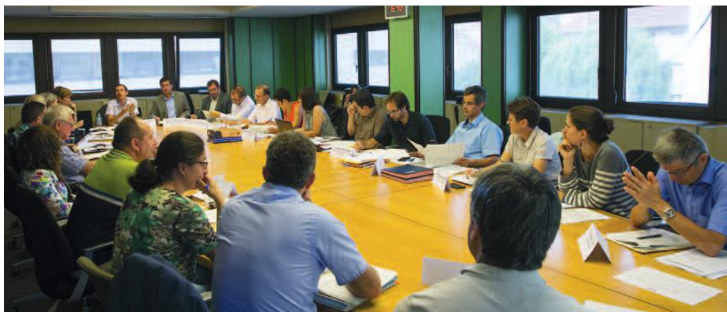
Réunion du Conseil Syndical du Symbhi.