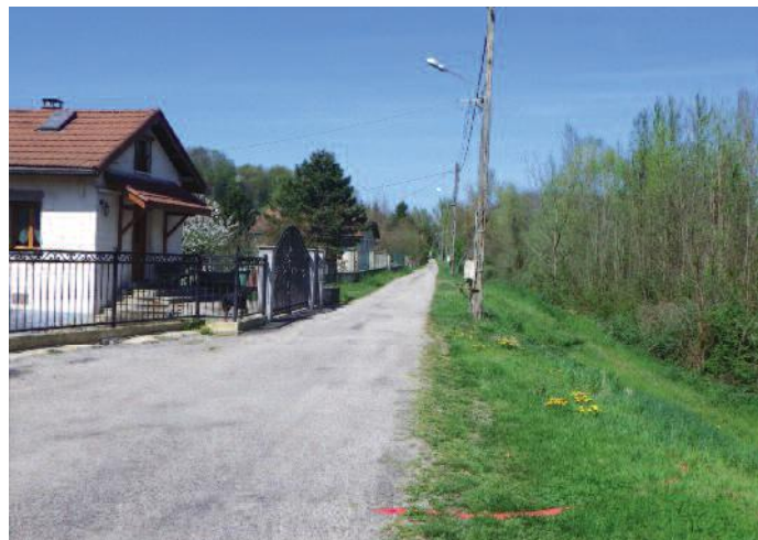
Digue de l'Isère à Barraux.

Le budget finalement accordé sera utilisé pour sécuriser la digue de Barraux, au niveau du pont de la Gâche, au moyen d'un rideau de palplanches. Après la désignation fin juin du nouveau maître d'œuvre devant réaliser les travaux des tranches 2 et 3, ce chantier qui n'engage aucune contrainte foncière pourra être mis en œuvre dès novembre prochain, au terme de l'attribution d'un marché public dont la consultation sera lancée dans le courant de l'été.