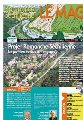
Magazine grand public « Romanche Séchillienne »