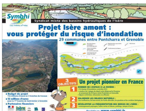
Panneau pédagogique « Isère amont »