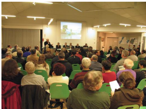
« Réunion publique Isère amont »