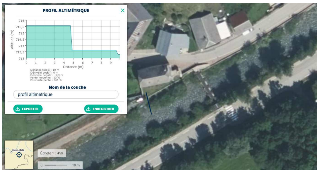
Figure 2 : Configuration topographique au droit du linéaire à déclasser

Ce linéaire n'a pas été inclus dans le système d'endiguement car la configuration de digue n'a jamais existé comme on peut le voir sur l'extrait ci-dessous. Le jardin entre la maison et la digue est complètement remblayé.