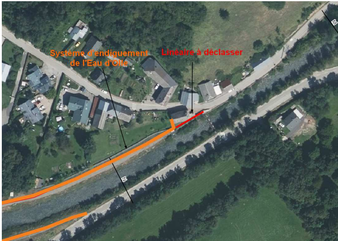
Figure 1 : Localisation du linéaire à déclasser