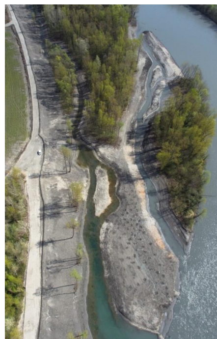
Schéma de principe et photographie illustrant la restauration du site de Pré Pichat